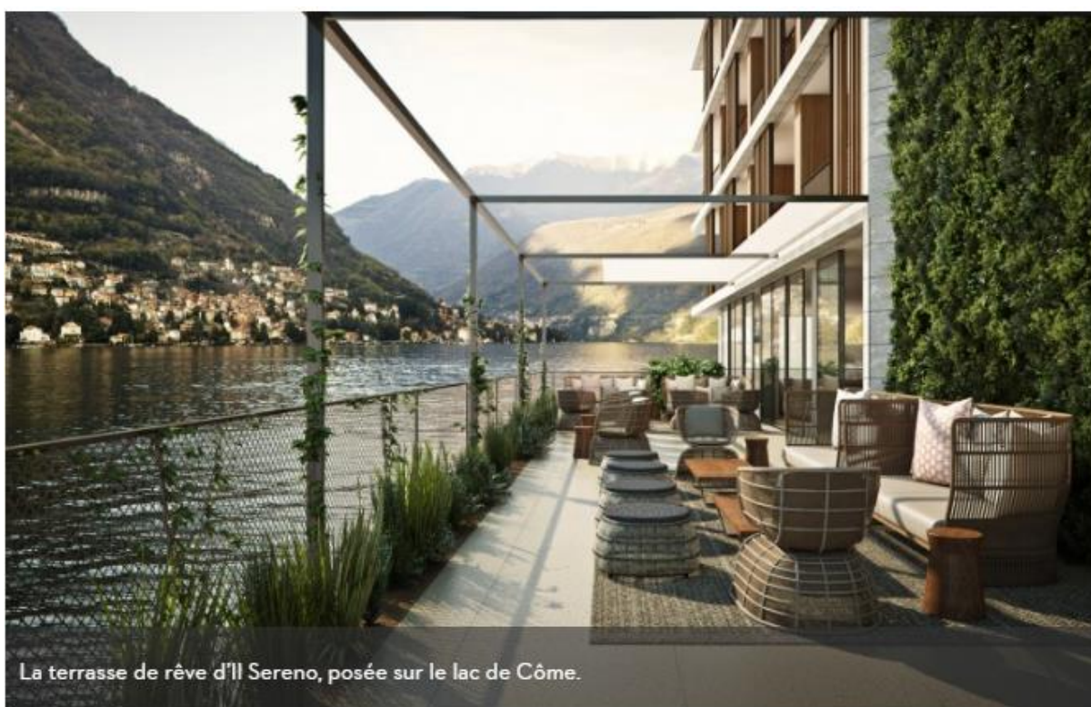
La terrasse de rêve d'Il Sereno, posée sur le lac de Côme.