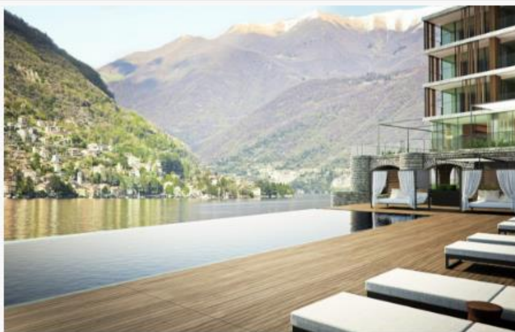
Hôtel 5* Il Sereno

HÔTELS & PALACE | Imaginé par l'architecte Patricia Urquiola, Il Sereno est un nouvel hôtel qui s'établit sur le lac de Côme depuis une dizaine d'années.