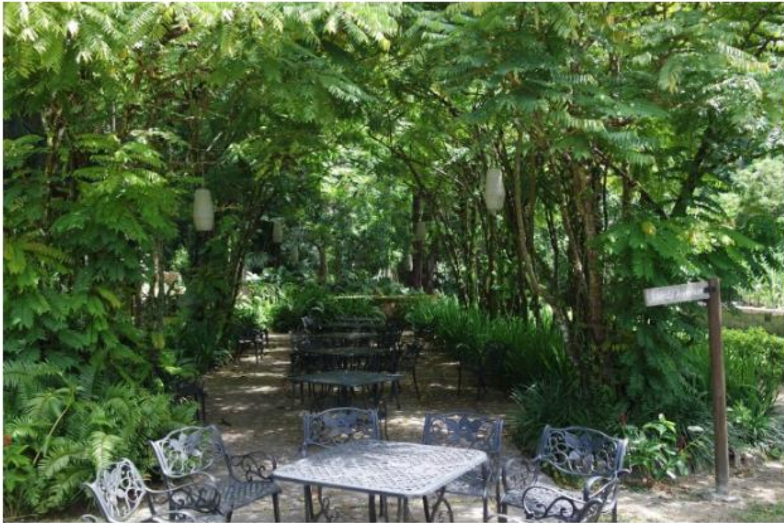
Le Domaine de la Plaine St André

Direction le littoral sud-est de l'île ... On nous a indiqué une escale incontournable baptisée Le Domaine de la Plaine St André . Après avoir aperçu de belles plages sur lesquelles les rochers granitiques sont frappés par le soleil et balayés par les eaux claires, on pénètre dans une imposante cour où l'on découvre une demeure de style colonial français. Dans cette maison construite en 1792, les aventuriers d'autrefois venaient déguster les délices locaux. Aujourd'hui, les visiteurs y découvrent la fabrication du Rhum Takamaka Bay avant de déguster les plats du Chef face à la jungle tropicale. Les accents locaux nous immergent dans un dépaysement total... Les notes boisées de ce vieux rhum, que l'on déguste en prenant notre temps, se mêlent aux saveurs des coeurs de palmiers, des poissons et des nombreux mets mis à notre disposition. On profite paisiblement du moment sous une chaleur réconfortante.