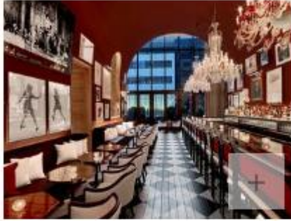
Le Baccarat Hotel, restaurant new-yorkais à la décoration française.