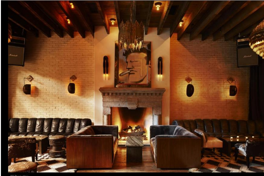
DP The Ludlow