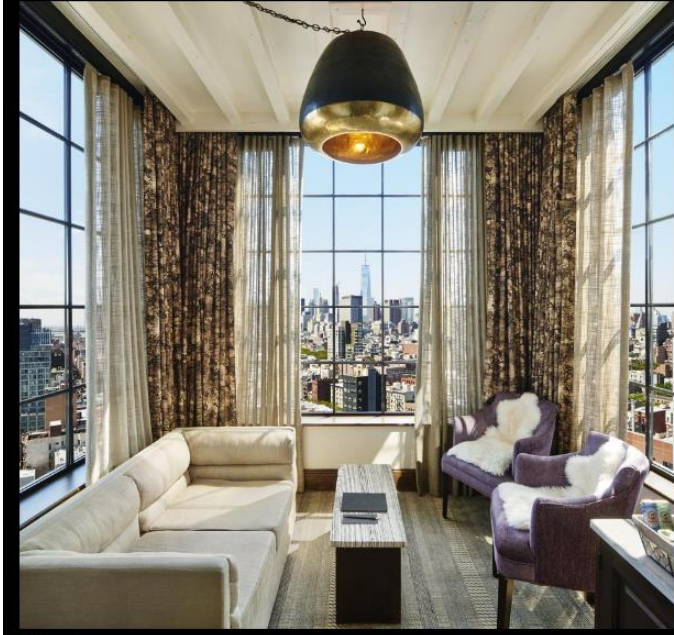
DP The Ludlow