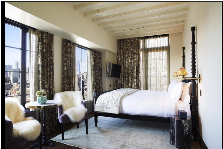
DP The Ludlow