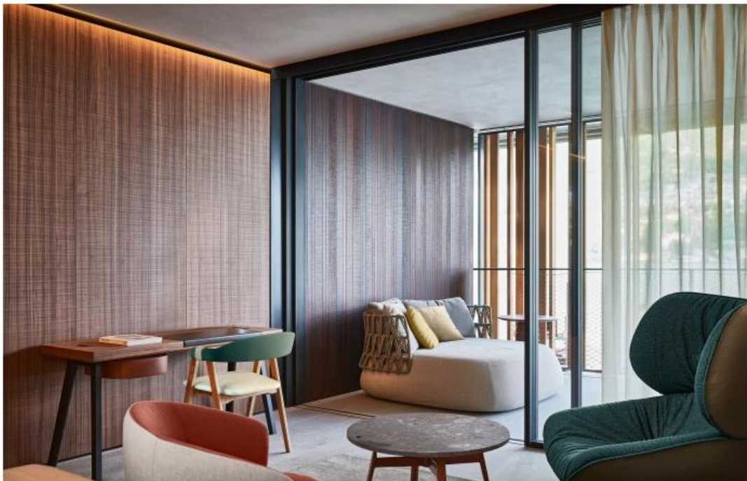
Il Sereno Lago di Como, Via Torrazza 10, Torno – lac de Côme, Italie.