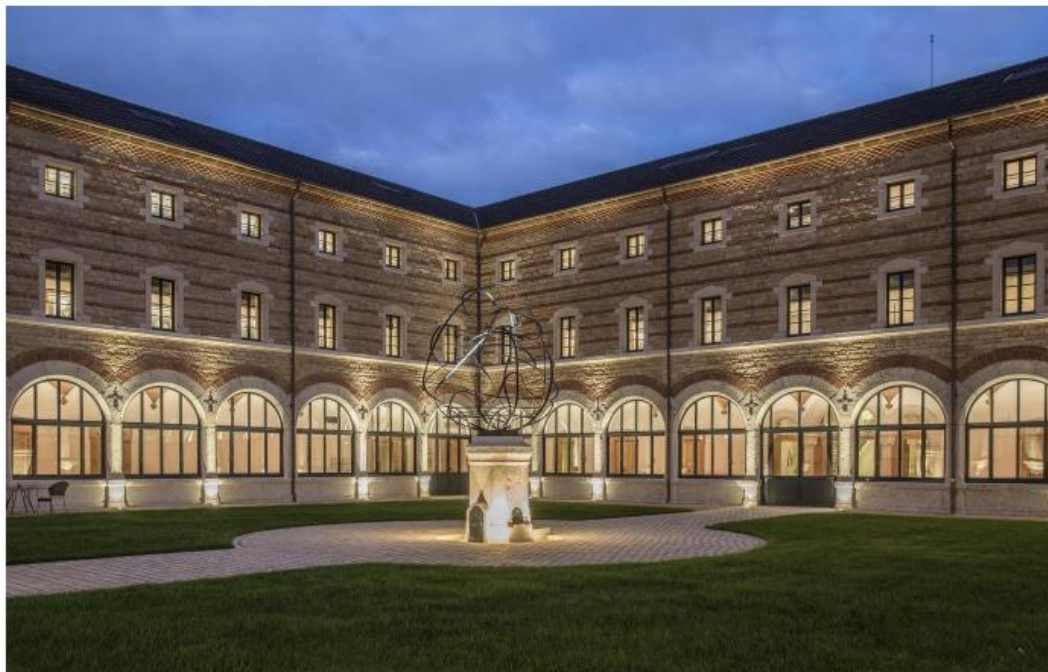
Hôtel Fourvière, 23, rue Roger-Radisson, Lyon.