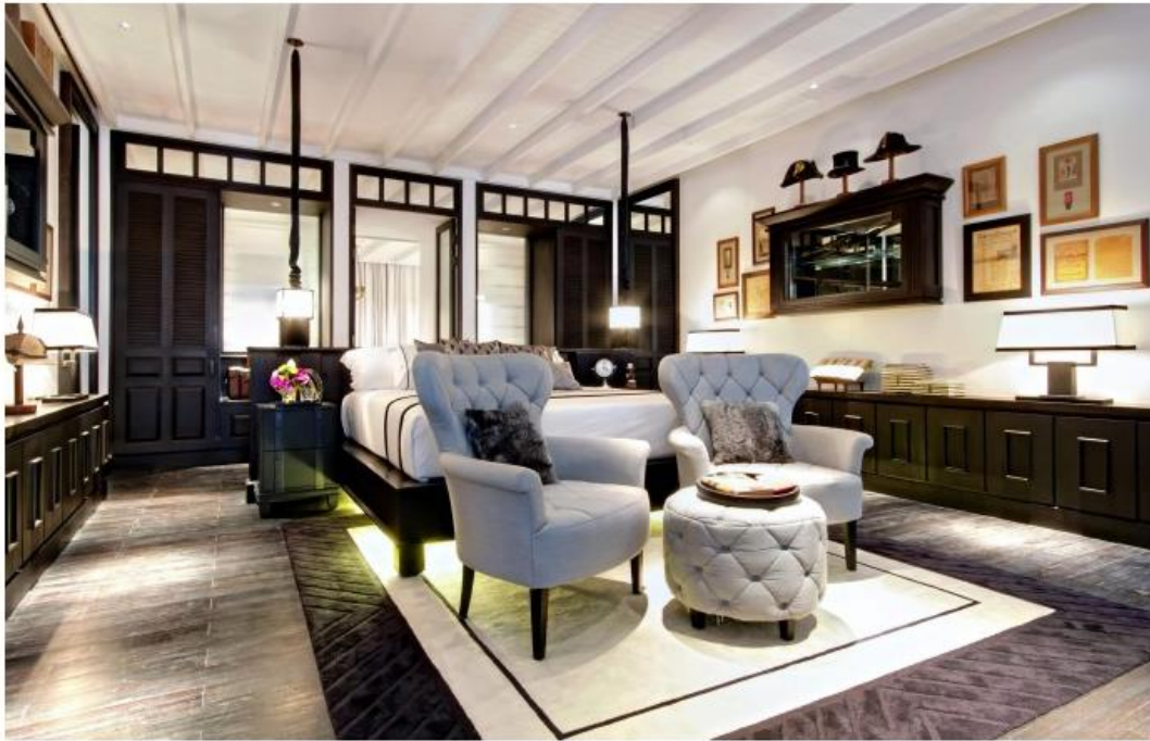
The Siam Hotel, 3/2 Thanon Khao, Vachirapayabal, Dusit, Bangkok.