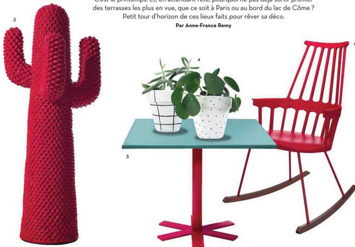
Page de gauche Terrasse du Sinople, le restaurant gastronomique du club de sport Klay Saint Sauveur, un espace signé Charlotte Biltgen, qui a mis à profit l'apport de lumière pour créer une oasis de verdure sous la verrière escamotable. Fauteuils Casamania. Klaysaintsauveur.fr 1/ Suspensions Bamboo Light, design Anik Levy, à partir de 171 €. Forestier. 2/ Plateaux Be Bop a Lula, en bambou laqué à la main, design India Mahdavi, 280 €. India Mahdavi. 3/ Portemanteau Coctus, design Drocco et Mello, 3980 €. Gufram. 4/ Cache-pots peints à la main, à partir de 16,90 €. Fleux. 5/ Table Parrot, plateau en acier émaillé, design India Mahdavi, 1540 €. Petite Friture. 6/ Fauteuil à bascule Comback, design Patricia Urquiola, 540 €. Kartell.