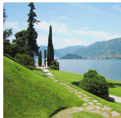
FASTE Les jardins de la villa Melzi, de style anglais.