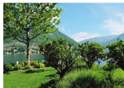
NATURE Le micro climat du lac de Côme est propice aux orangers.

Mais le lac de Côme ne se limite pas à un éden doré pour aristocrates. C'est dans ses petits villages de pêcheurs, ses sentiers de randonnée en montagne et ses abbayes romanes que ce site révèle tout son charme, au-delà de son imagerie d'aquarelle.