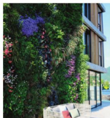
TENDANCE L'Hôtel Il Sereno se distingue par ses façades végétalisées.

Cette nouvelle oasis pour privilégiés a confié l'aménagement de ses espaces verts au plus célèbre concepteur de murs végétalisés – Patrick Blanc – dont les créations verticales ornent déjà musées, aéroports et autres lieux publics. Le bateau est à deux pas pour qui souhaite naviguer d'un débarcadère à l'autre.