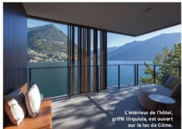
L'intérieur de l'hôtel, griffé Urquiola, est ouvert sur le lac de Côme.

Situé près du petit village de Torno, l'hôtel « Sereno Lago di Como » est l'une des nouvelles adresses les plus renommées et branchées de la région. Membre des Leading Hotels of the World ( www.lhw.com ), il contraste drastiquement avec les autres établissements cinq étoiles du lac par sa modernité et son design déroutant. Situé au bord de l'eau,