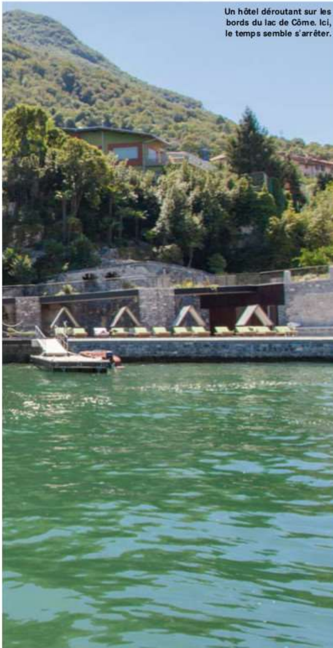
Un hôtel déroutant sur les bords du lac de Côme. Ici, le temps semble s'arrêter.

on le rejoint en voiture par des routes escarpées ou – c'est évidemment plus tendance – en Riva. Le ponton d'arrivée est à quelques mètres de la réception. Luxe, calme et volupté... Le « Lago di Como » est le deuxième hôtel créé par Luis Contreras, le propriétaire espagnol du Groupe Sereno Hotels. Le premier a, depuis 2005, pignon sur le lagon de l'île de Saint-Barthélemy, dans les Antilles françaises.